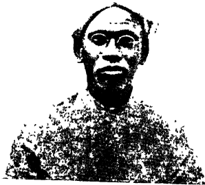
C. Sundara Sastrigal The Poet